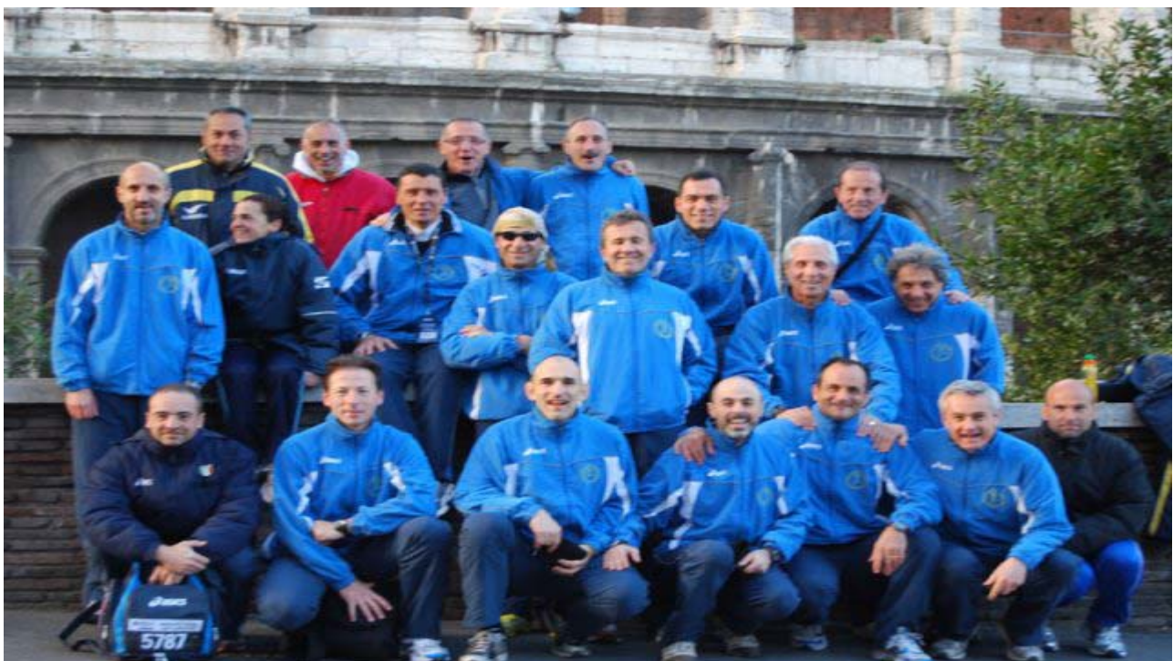
Foto di gruppo davanti al Colosseo in occasione della Maratona di Roma 2009

Tante identità, che nello sport individuale per eccellenza, diventano squadra.